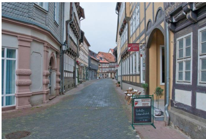
Eine Einkaufszone ohne Läden ....